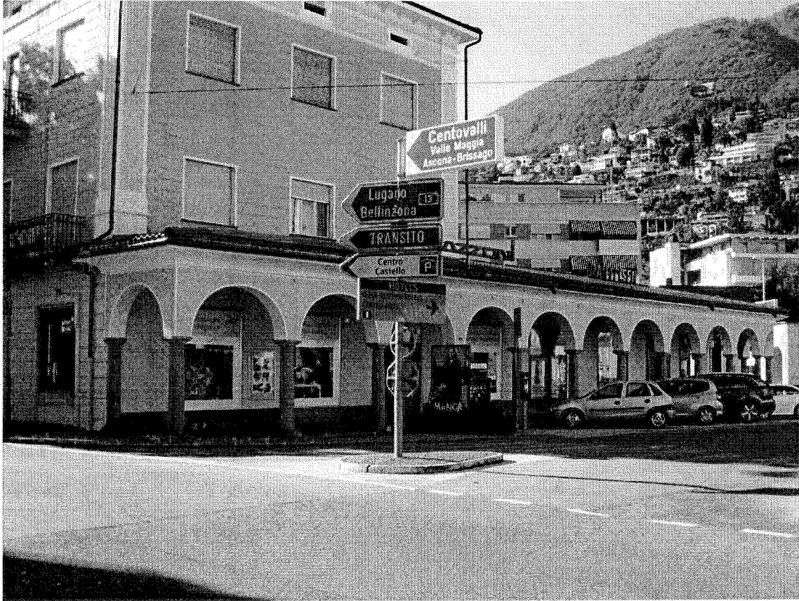
Dettaglio foto soprastante